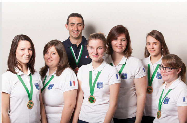
L'équipe junior féminine championne du monde 2014